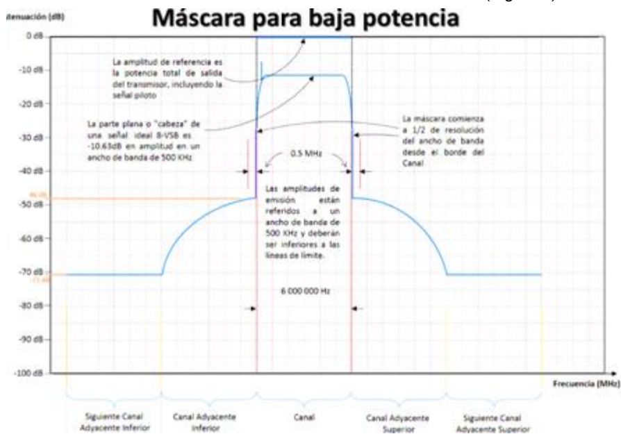
Figura 2. Máscara de emisión para Estaciones de Televisión y Equipos Complementarios de Baja Potencia

Donde \Delta f = Es la diferencia de frecuencia en MHz desde el borde de canal (Figura 2).